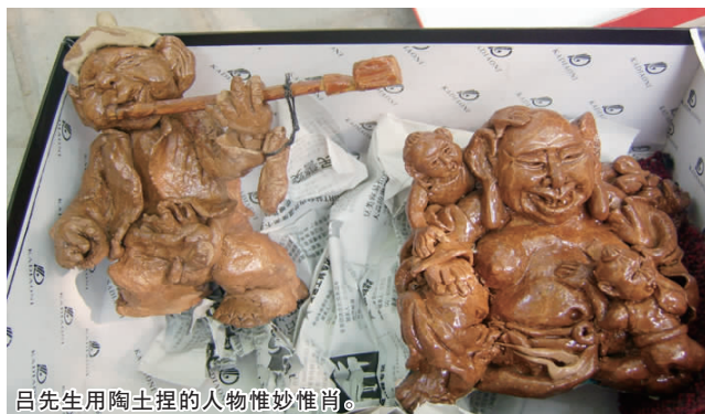
吕先生用陶土捏的人物惟妙惟肖。