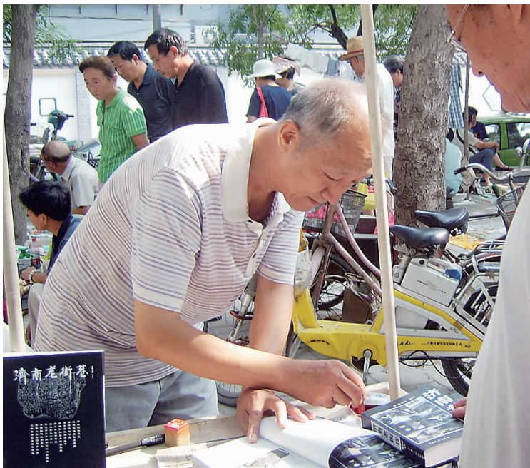
作家唐先生正在给大家签名。

唐先生说自从自己出书以来,就把书送给了好多左邻右舍,也跟着换物节走进了不少小区,他愿意为大家讲述各个小区历史的辉煌瞬间。如果您愿意听老街巷的故事,赶紧报名参加下一届换物节吧!