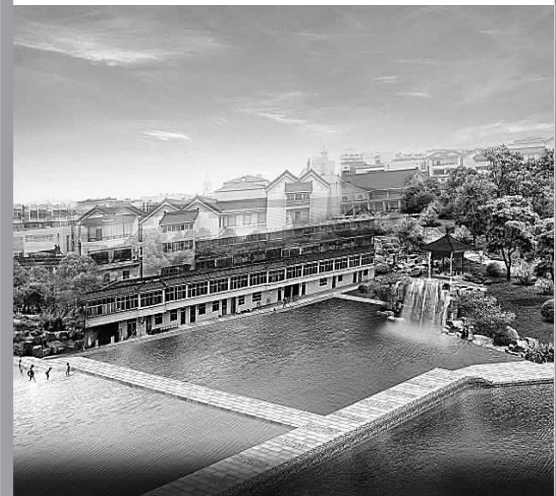
即将开建的泉水浴场规划图。