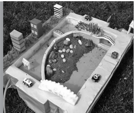
6年前同学们自己动手制作的泉水浴场模型。

“同学们关心参与省城建设的热情应充分肯定,此件转鲁豫同志(杨鲁豫时任济南市委副书记、常务副市长)阅,并请给同学们一个答复。”这份批示给了学生们莫大的荣誉和信心,大家都觉得建泉水浴场的事儿一定能成。