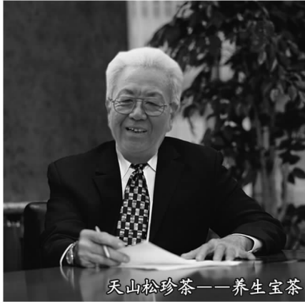
天山松珍茶——养生宝茶

心电图正常了，冠状动脉粥样硬化也消失了，真得好好感谢天山野生松珍茶，治好了我的病。”