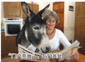
“门户开放”,与驴共处