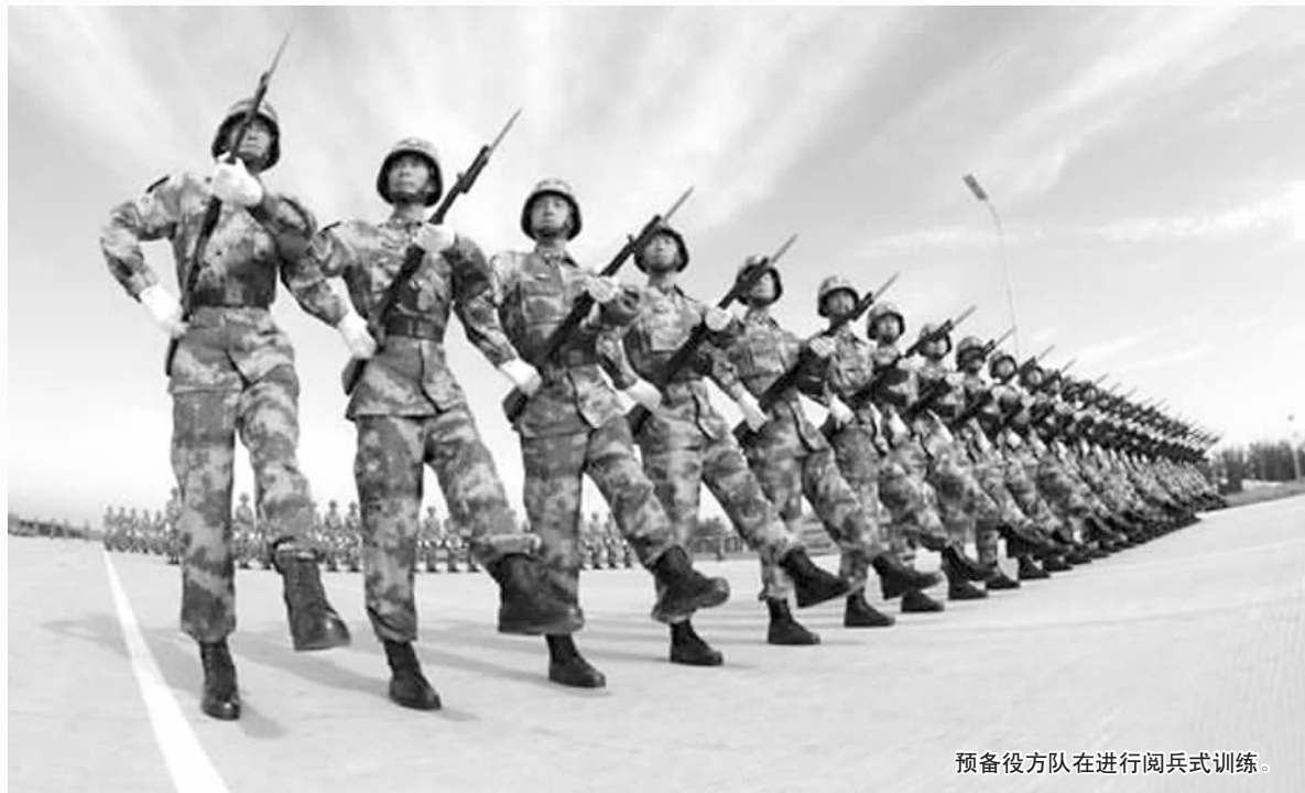
预备役方队在进行阅兵式训练。

中国陆军特种部队和武警的雪豹突击队,这两支被赋予了特殊作战任务的部队,由于身份特殊,自成立之日起就一直远离公众的视线,从未在公开场合亮相,今年的国庆阅兵式上,这两支特种作战部队将首次受阅。