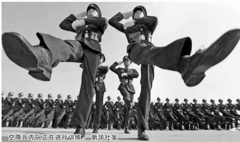
空降兵方队正在进行训练。

最后是空中梯队。12个空中梯队包括预警机、轰炸机、加油机、歼轰机、歼击机、直升机、教练机梯队将通过天安门上空,飞行时间约9分20秒。