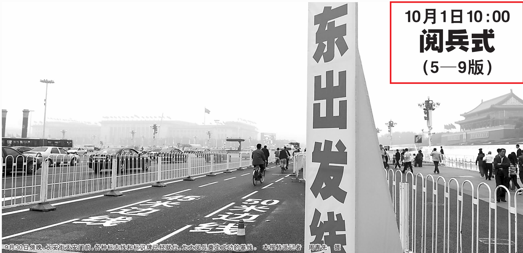
9月30日傍晚,长安街天安门前,各种标志线和标识牌已经就位,为大阅兵奠定成功的基线。