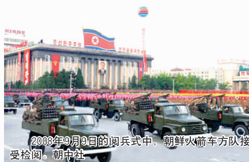
2008年9月9日的阅兵式中，朝鲜火箭车方队接受检阅。