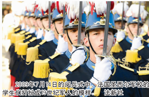
2009年7月14日的阅兵式中，法国圣西尔军校的学生们打扮成19世纪军人的模样。