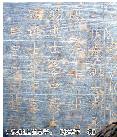
墓志铭上的文字。

据郭俊峰介绍,土屋路周围和附近的八里洼地区以前就出土过一些档次较高的古墓,因此估计周围地区在以前可能是一片古墓区。他说,只有高规格的古墓才会有墓志铭,这块墓志铭的出土,说明这座古墓主人的身份很高,很有考古价值。