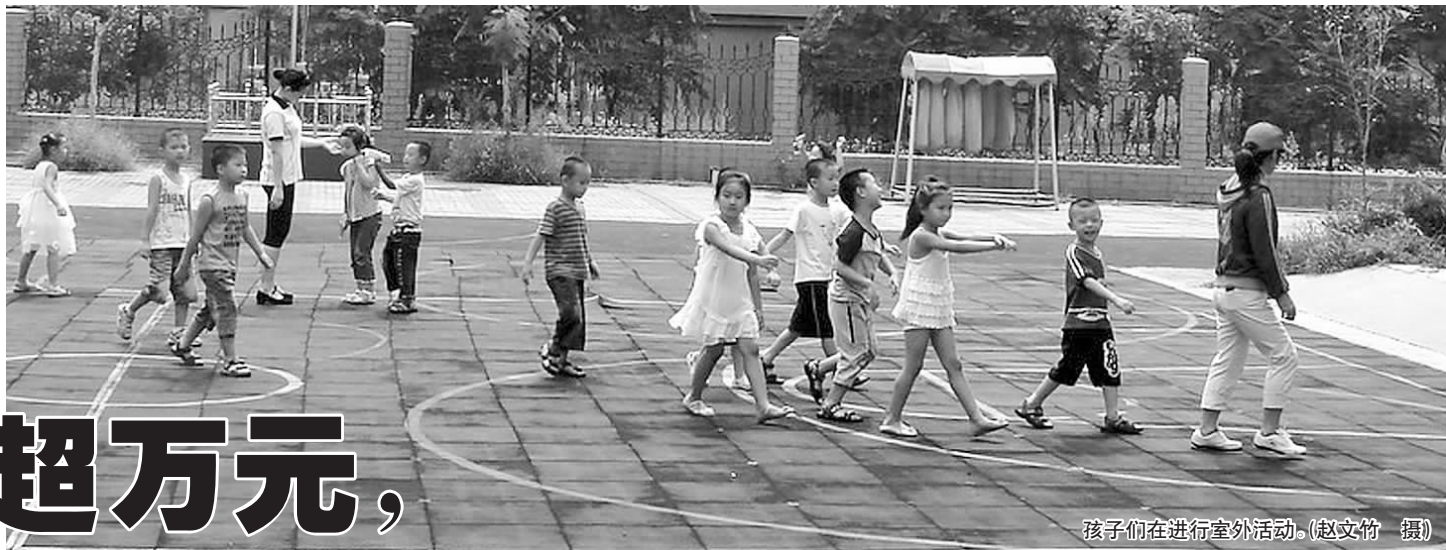
孩子们在进行室外活动。