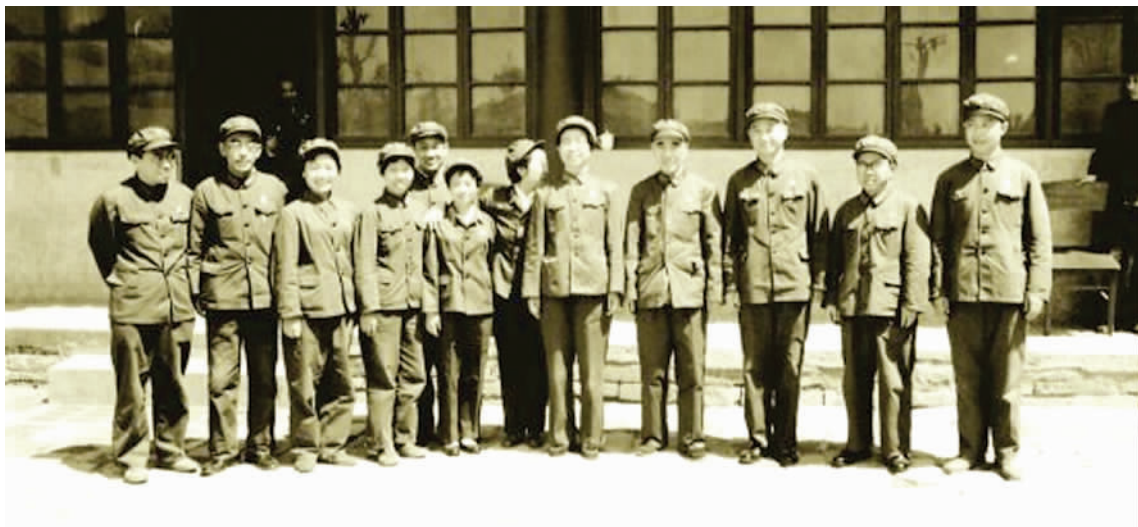
左起：阎长贵、毛泽东警卫员王宇清、江青护士许春华与张素兰、陈伯达秘书王保春、毛泽东护士长吴旭君、叶群、江青、林彪、毛泽东保健医生李志绥、毛泽东机要秘书徐业夫、江青警卫员孙占龙1967年合影