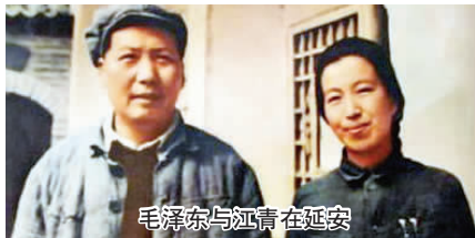
毛泽东与江青在延安

上世纪30年代的江青有另外一面。那时她利用艺术形式，如演话剧、演电影，还写文章，为提高妇女地位，争取妇女解放，以及反对日本帝国主义的侵略，做了不少有益的工作。