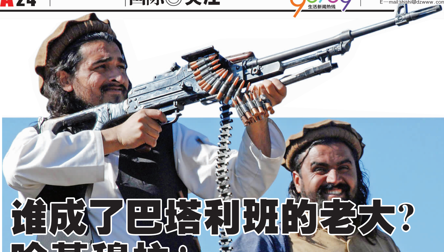
这是2008年11月26日拍摄的哈基穆拉·马哈苏德(左)的资料照片。