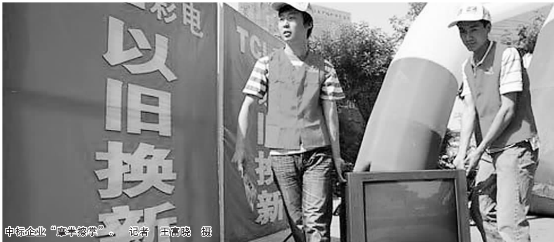
中标企业“摩拳擦掌”。