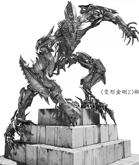
《变形金刚2》部分造型