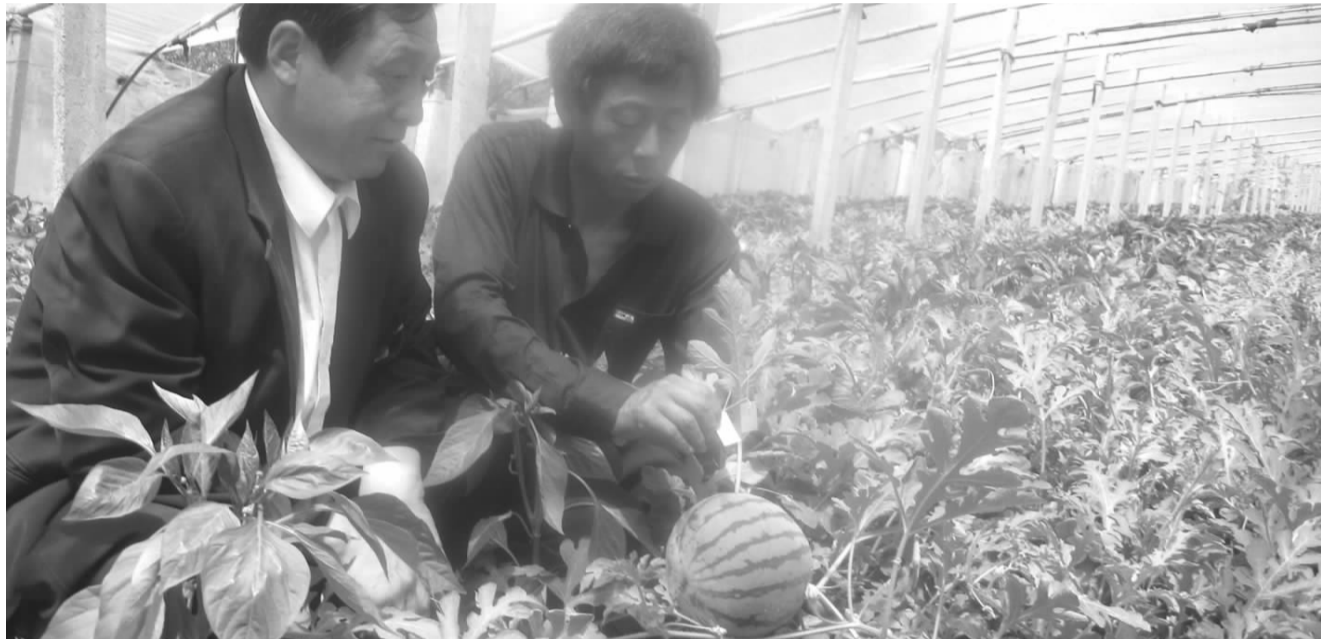
每个西瓜上都贴有品牌牌,记录西瓜成熟时间。

一”期间的西瓜价格比往年略高,这与时令水果短缺和今春气温较低有很大关系。从目前行情看,“五一”期间西瓜需求量能保持在每天400余吨,而且由于需求量大,价格不会下跌。但是“五一”前后的西瓜,大部分产自昌乐、临朐等地,5月中旬开始,本地西瓜才能大量上市,价格肯定是只跌不涨。如果市民想吃到便宜的西瓜,还要再等上半个月。