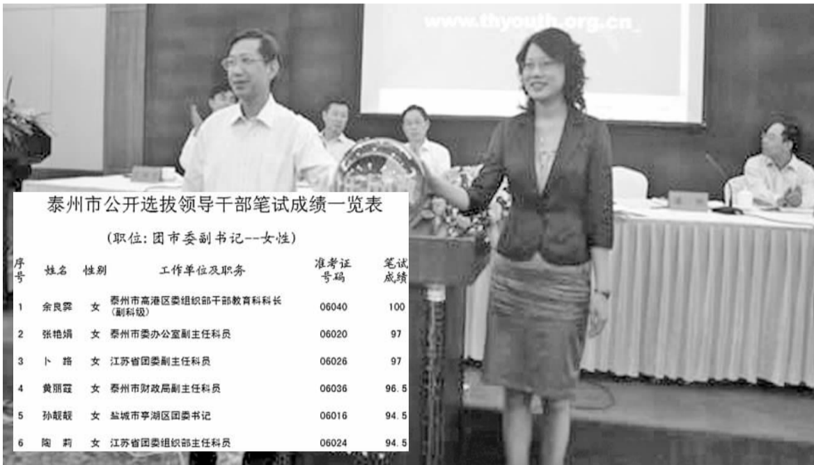
泰州市公开选拔领导干部笔试成绩一览表