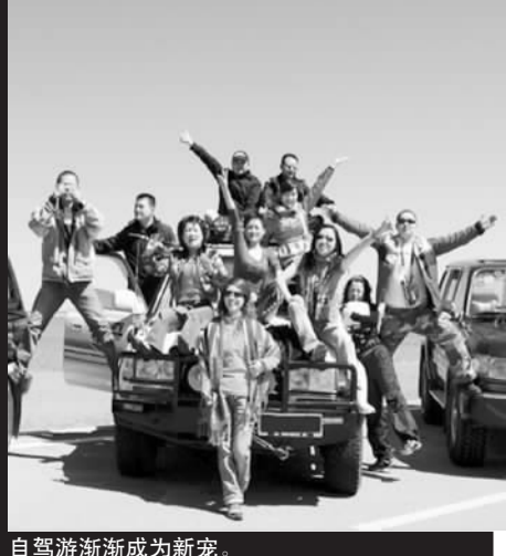
自驾游渐渐成为新宠。