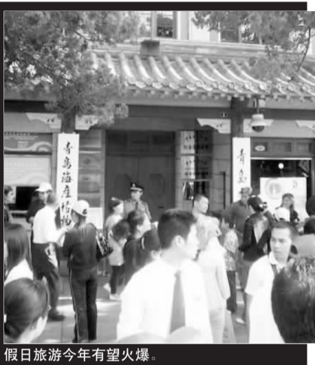
假日旅游今年有望火爆。

黄金周长线游为特征的“假日经济”将代之以短途游、周边游为特征的“周末经济”, 人们在两小时自驾游生活圈的周末餐饮郊游、休闲度假活动将更显活跃。