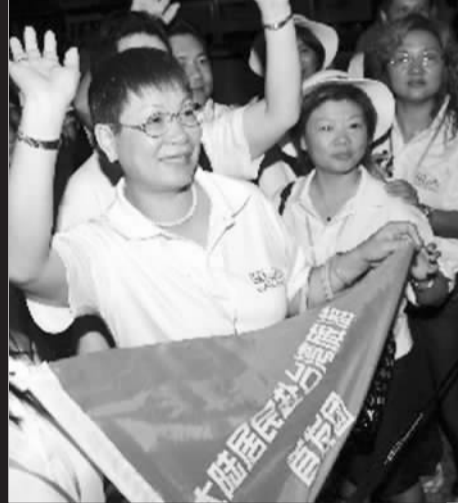
高端“台湾游”将走向大众化。