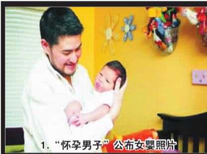
1. “怀孕男子”公布女婴照片