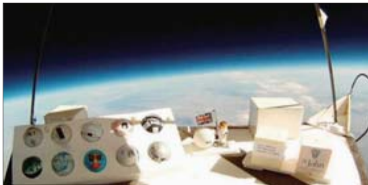
▲福赛思研制的太阳能感应器。