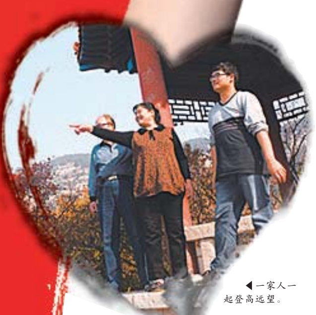
▲一家人一起登高望远。