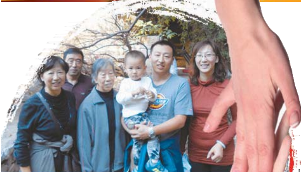
▲一家老少四代人一起登山。