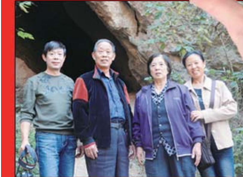
▲德州读者专门赶来参加本报活动，在娄敬洞前合影。

米老太太则稍微有点恐高，她坚持在山下等待着儿女和老伴，“带着我出来一趟，他们自己也能玩玩，我爬不上山无所谓，除了一家人在一起，就不算过了这个重阳节了嘛。”