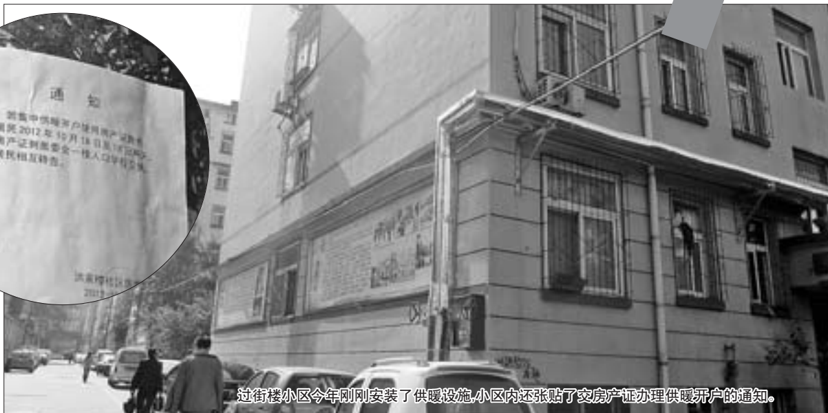
过街楼小区今年刚刚安装了供暖设施,小区内还张贴了交房产证办理供暖开户的通知。