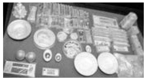
▶价值约400万元的赃物全部被追回。