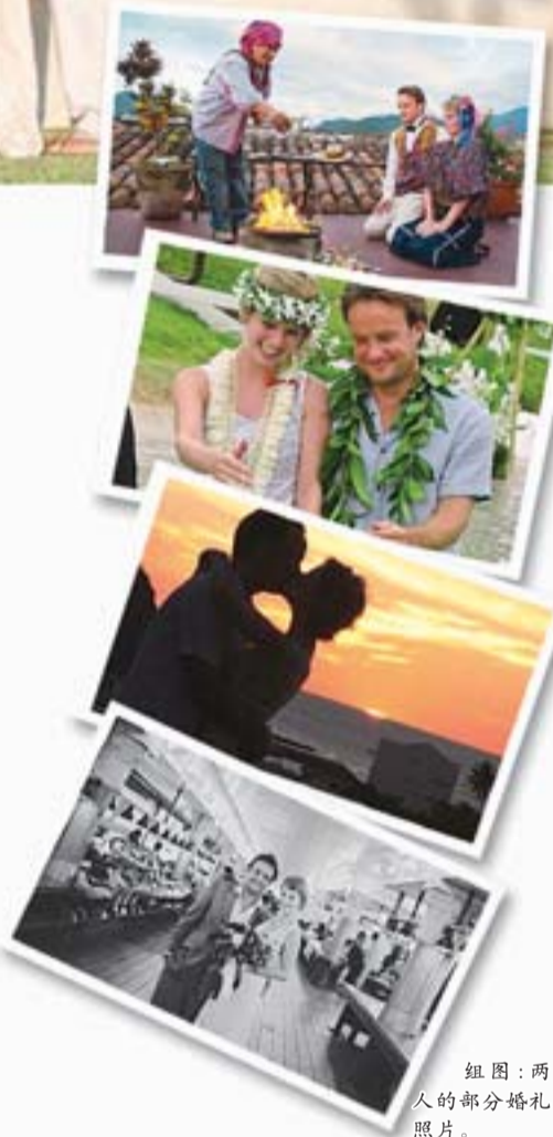
组图：两人的部分婚礼照片。