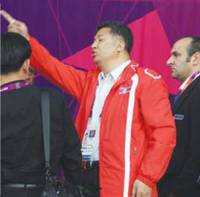
◆本片纯属虚构,如有雷同纯属巧合◆

“很明显,这是一个错误。我们将向朝鲜队以及朝鲜奥委会道歉,此外我们还将采取举措,以确保类似事件不再发生。”