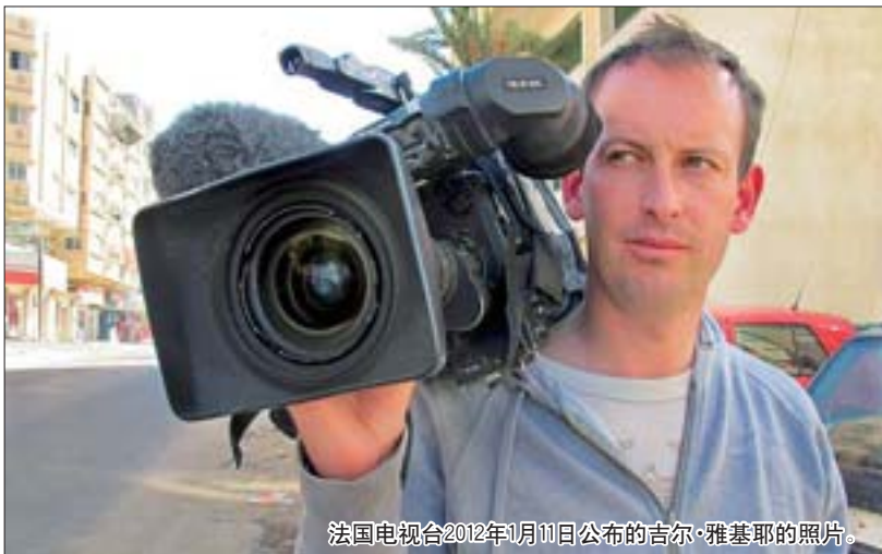
法国电视台2012年1月11日公布的吉尔·雅基耶的照片。