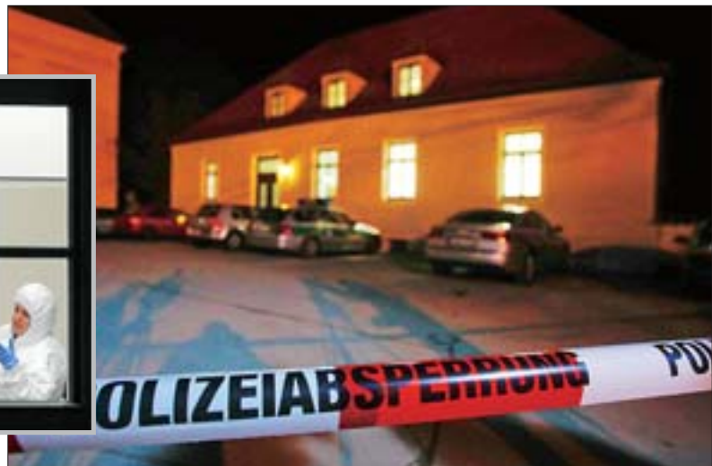
上图:1月11日,警察在德国巴伐利亚州达豪市发生枪击事件的地区法庭外拉起警戒线。