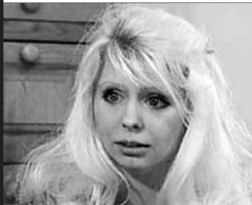
英国媒体公布的坦娅近期照片。