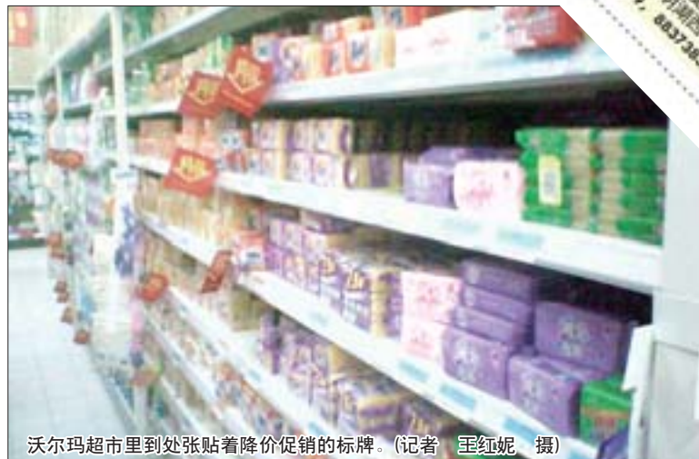
沃尔玛超市里到处张贴着降价促销的标牌。