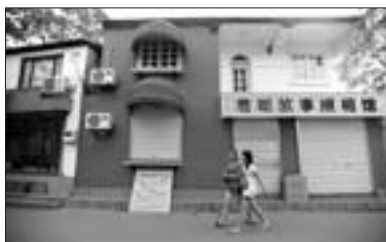
曲水亭街原来沿街的烧烤店没有了,取而代之的是茶馆、照相馆等。