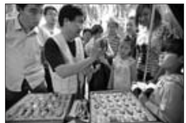
民俗节上,民俗艺人现场制作的精美蛋雕吸引了不少市民的目光。