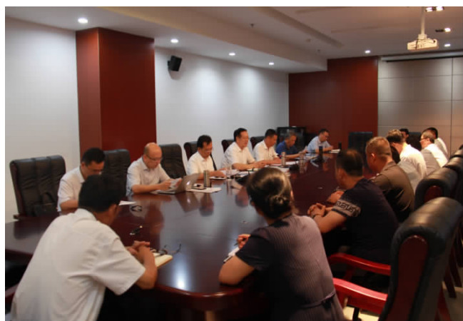
省司法厅二级巡视员孙成文带领的第八督导组在济宁市进行整改专项督导,并召开座谈会。