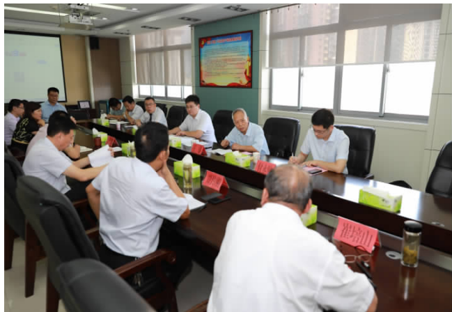
省司法厅副厅长齐延安带领的第五督导组在枣庄市进行整改专项督导,并召开座谈会。