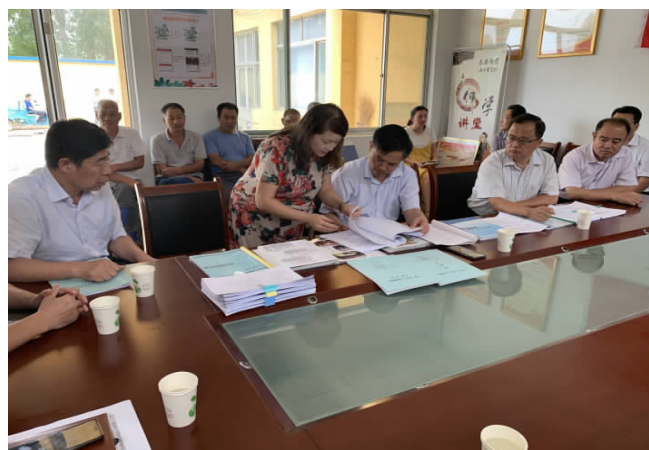
省司法厅副厅长李端卫带领的第七督导组在东营市进行整改专项督导,并召开座谈会。