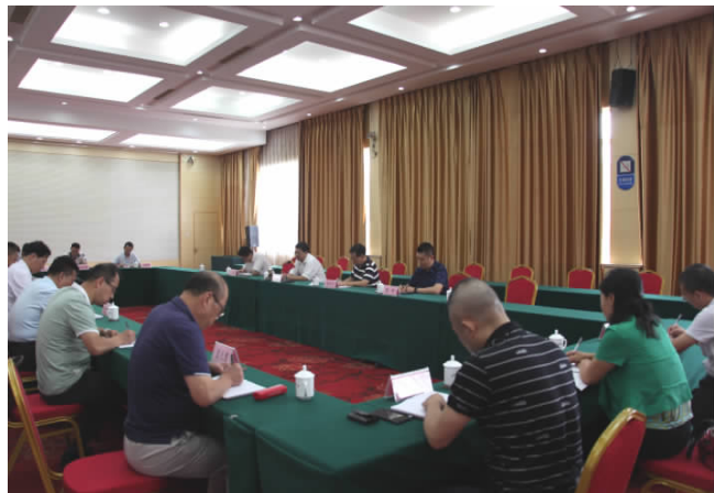
省司法厅副厅长马灵喜带领的第四督导组在烟台市进行整改专项督导,并召开座谈会。