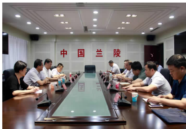
省司法厅副厅长朱晓峰带领的第六督导组在临沂市进行整改专项督导,并召开座谈会。