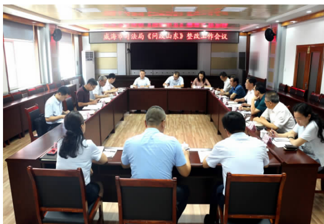
省司法厅二级巡视员李邦喜带领的第九督导组在威海市进行整改专项督导,并召开座谈会。