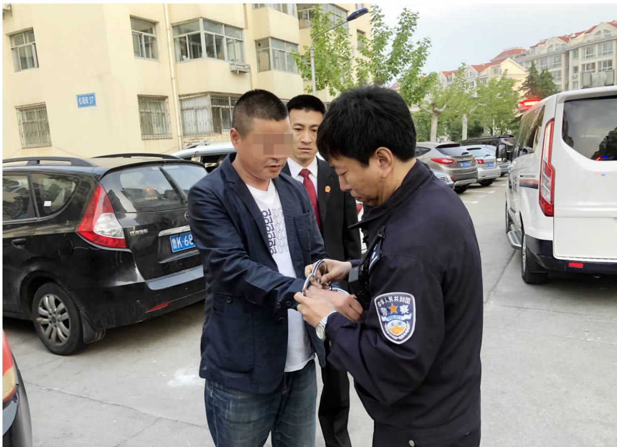
日前，威海火炬高技术产业开发区人民法院开展凌晨集中执行行动，并对执行过程进行网络直播，全方位展示人民法院切实解决执行难的决心。此次行动涉及案件35件，传唤到庭3人，现场实施司法拘留1人，其中送拘1人，达成和解3人，和解标的额75.42万元，当日追回执行款1.3万元。

菏泽中院在做好审判工作的同时，积极回应市场发展过程中出现的合理利益诉求，结合审判调研，努力优化法治化营商环境。