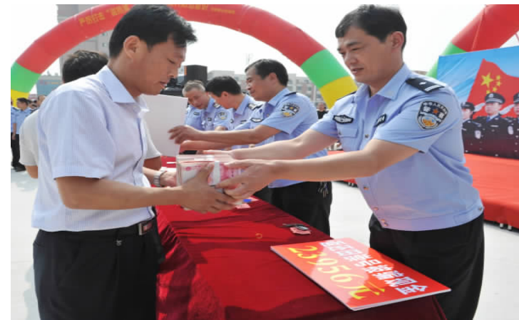
日前，巨野县公安局在县城广场举行赃款大会，将缴获的赃款赃物返还给群众。