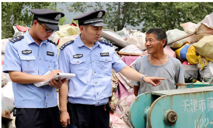
近日，枣庄市公安局山亭分局危城派出所对辖区废品收购业进行突击检查，及时堵塞违法犯罪分子的销赃渠道。