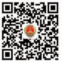
山东省人民检察院官方微博