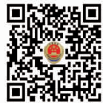
山东省人民检察院官方微博