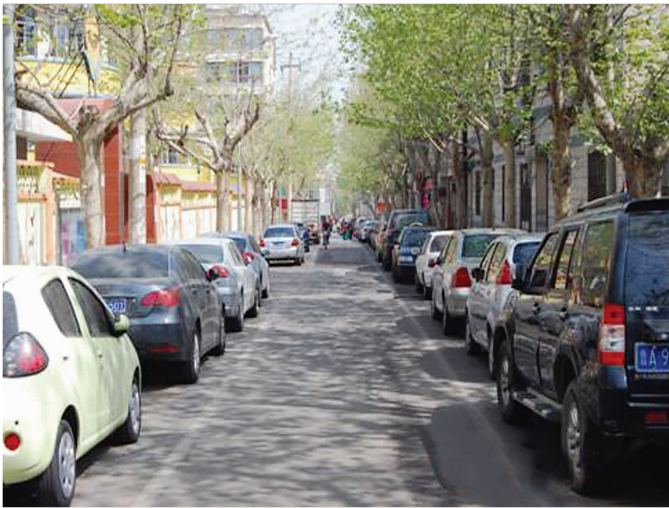
实现良性交通微循环后,燕山小区的交通秩序井然。

目前,历下交警大队已在佛山苑社区、燕山社区、司里街、青后、十亩园、菜市新村等9个社区进行了微循环改造。