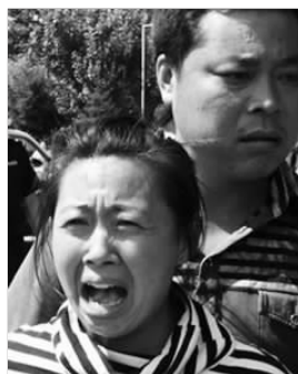
事故现场附近的群众。

记者从伊春市新区的政府工作人员处了解到,紧挨烟花厂的新区政府机关和事业单位已放假。