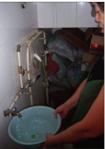
自来水管中流出的水散发农药味,居民不敢饮用,只能用来冲厕所。