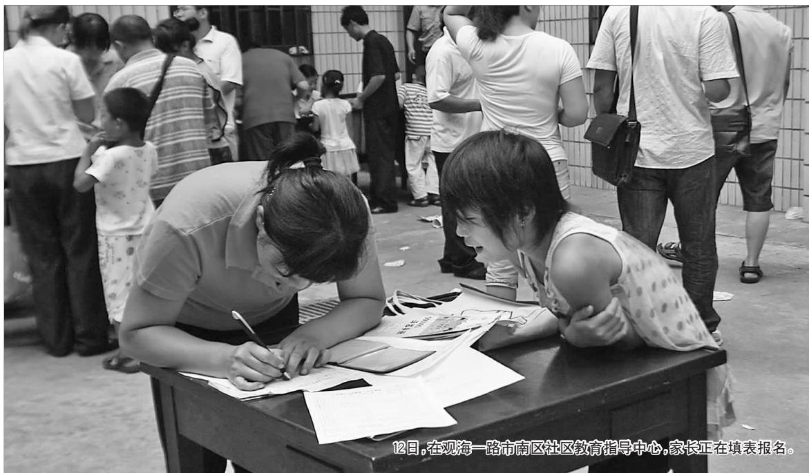
12日,在观海一路市南区社区教育指导中心,家长正在填表报名。

本报7月12日讯(记者 于健 曲凯) 12日,在青岛市内四区,外来务工人员子女入学报名时同时启动。在一些报名点,报名的家长排起了长队,报名序号提前发光,“外来娃”报名人数今年持续看涨。