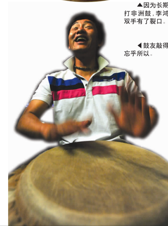
鼓友敲得忘乎所以。

您有什么熟悉的圈子?有什么有趣而难忘的圈子故事?希望您通过我们讲给大家听,来稿择优刊登,稿费奉上。来稿请发至 zhanghongbo@qlwb.com.cn