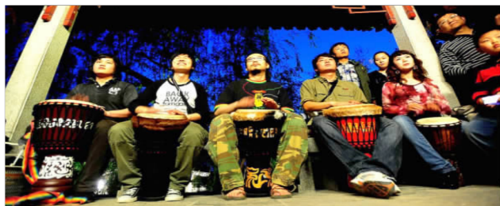
鼓友们学得很认真

“一殿下”想学非洲鼓,一方面因为这种鼓易于上手,大家一起打鼓,强烈的节奏起来后,什么烦恼事都忘了,每次活动完都非常开心满足。”她说。另一方面,她觉得技师手工制作的非洲鼓本身就是艺术品,着迷于鼓上的各色花纹。可是,济南现在还没有卖非洲鼓的地方,她在网上看了很久也没找到自己喜欢的。她坚持认为,鼓如衣服,无论尺寸、花色,都要挑选适合自己的。“一殿下”经常在网上搜索