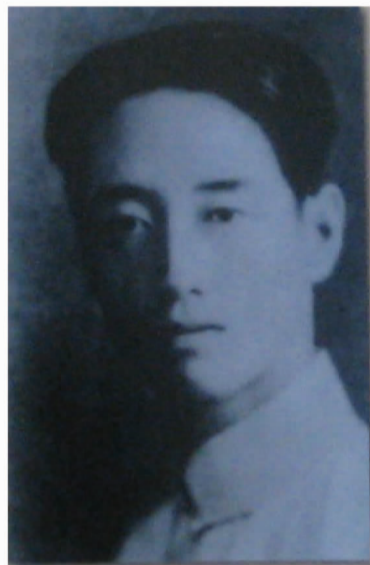
臧克家1933年在青岛留影

三人中，闻一多、王统照对臧克家来说是前辈、师辈，而王筱房是同时代人。正像当年沈从文助卞之琳一样是十分不易的。