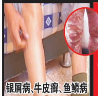
银屑病、牛皮癣、鱼鳞病

症状：甲癣有两种类型。一种表现为白甲，另一种损害先从甲游离缘和侧壁开始，使甲板出现小凹陷或甲横沟，逐渐发展至甲板变脆、易碎，增厚，呈内褐色。甲下碎屑堆积常使甲变空，翘起与甲床分离，甲板表面凹凸不平，粗糙无光泽。 使用复方黄柏祛癣搽剂：7天左右祛病甲，28天换新甲，坚持使用2疗程，可彻底治愈不复发。