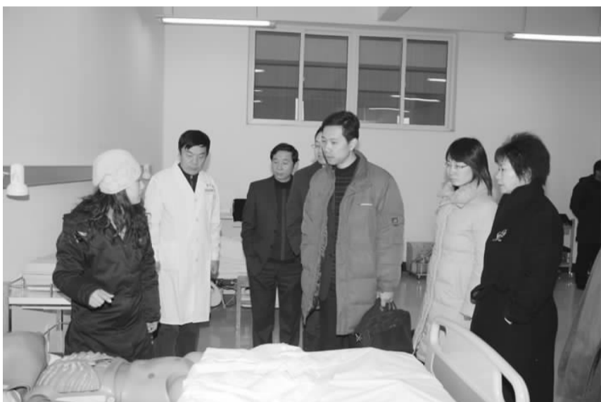
国家卫生部人事司专业人才管理处副处长段勇实地查看乡村医生培训技能课实验室

连续5年的乡村医生培训使学院积累了丰富的经验，并把实践经验应用到学院的日常管理工作中。