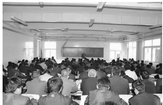
第五十三期乡村医生正在参加培训

“没有白来”，这朴素的话语道出了众多参加培训乡村医生的共同心声，“掌握更多的临床医疗知识”是乡村医生共同的心愿。山东协和职业技术学院已经搭建起山东省十万乡村医生进一步成长的平台，众多的乡村医生将在这个平台上，为进一步提高人民群众的医疗水平，为服务社会、奉献山东人民做出更大的贡献。