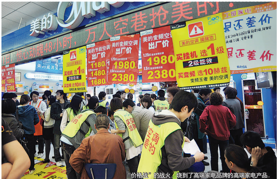
“价格战”的战火,烧到了高端家电品牌的高端家电产品。

“五一”天气够热火,但空调卖的比天气还热火多少倍!”省城泉城路某家电卖场美的空调专柜的销售人员称,他们品牌的空调今年卖的异常火爆,“开开开的手抽筋”,销量比去年同期至少增长了1倍以上。