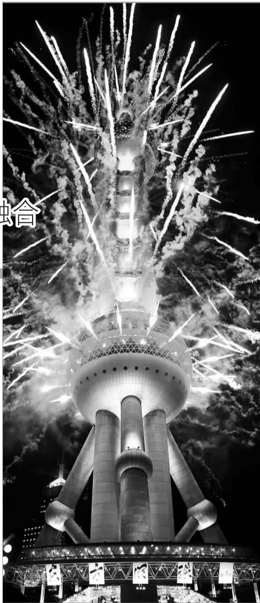
火树银花夜上海,姹紫嫣红黄浦江。

另外,按照“一次性投入、可循环使用”的原则,为了体现科学、勤俭办博的理念,开幕式出席者拿到的节目单、介绍手册及表演者手中的道具,都烙着环保的印记。