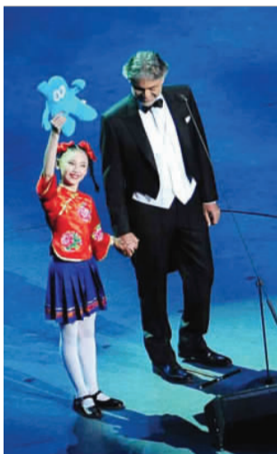
盲人歌手波切利和中国小女孩一同演出。

“每个城市都有不同的文明形态,而一个让人有幸福感的城市就是多种文明形态和谐相依的城市。”一位来自北京的同行说。