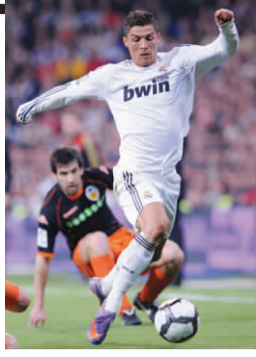
4月18日，皇家马德里队球员C罗在比赛中带球。当日，在西甲第33轮比赛中，皇马主场以2:0战胜巴伦西亚队。

国家体育总局在足球特殊的环境下，选派总局系统内的得力干部挂职支援足管中心工作。”对于目前在党校学习的原先的六名中层干部，韦迪表示由于机构大幅度调整，按照总局规定，原有聘约已经终止。在六人结束学习后，会根据需要安排他们的工作。由于挂职干部的期限是一年，因此足管中心将在一年内针对中层岗位启动竞聘。