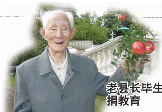
老县长毕生积蓄 捐教育 C04

新闻有奖热线： 13905350531 0535-6610123(烟台) 0631-5203337(威海)