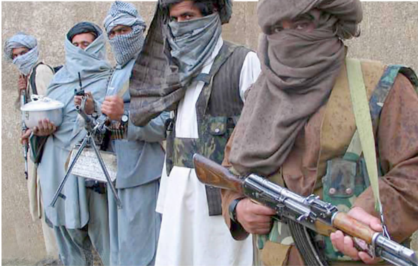
全副武装的塔利班人员。(资料片)