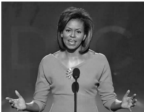
美国第一夫人米歇尔·奥巴马

本报讯 据路透社1月29日报道,美国卫生官员们借助第一夫人米歇尔·奥巴马的影响力,推出了一项反肥胖倡议活动。