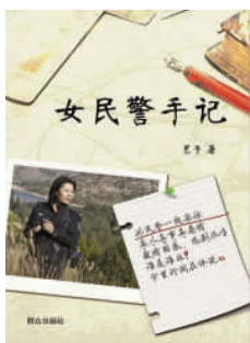
《女民警手记》 艺子 著 群众出版社

作者艺子(笔名)是我省临沂市的一名女民警,她在繁忙的公安工作之余,用了近一年的时间写成了纪实文学《女民警手记》。