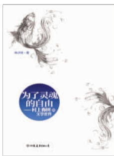
《为了灵魂的自由：村上春树的文学世界》 林少华 著 中国友谊出版公司

书中的村上文学未必属于村上春树,是因为他已然走出村上春树,而任人评说,在这里姑且是我这个译者眼中的村上文学。但又限于我这个译者——二十年来我有幸收到大量读者来信,