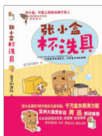
《张小盒杯洗具》 盒子创造社 著 现代出版社