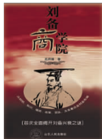
《刘备商学院》 孔祥靖 著 山东人民出版社

这是一场三个男人之间的战争。他们是对手,各为其主,必置对方于死地;他们也是朋友,危难之时,必挺身而出,拼死相救。他们有不同的追求,但是却都喜欢和尊重“销售”这门职业。他们的人性、智慧、无奈和挣扎在一场关于“销售”的战争中被淋漓尽致地表现出来。他们成长着,坚持着,却又不断地否定着。人在职场,心在天涯,他们在青春的消磨中体悟着人生的酸甜苦辣。