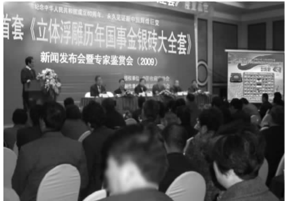
近日，来自海内外十几位专家齐聚一堂，对“新中国历年国事金银砖大全套”给予高度评价，公认为其价值达到前所未有的高度，将来肯定是一件不可多得的“宝贝”

一、历史价值：单个历史事件藏品个个价值很高！囊括61个重大事件藏品，更是价值非凡！