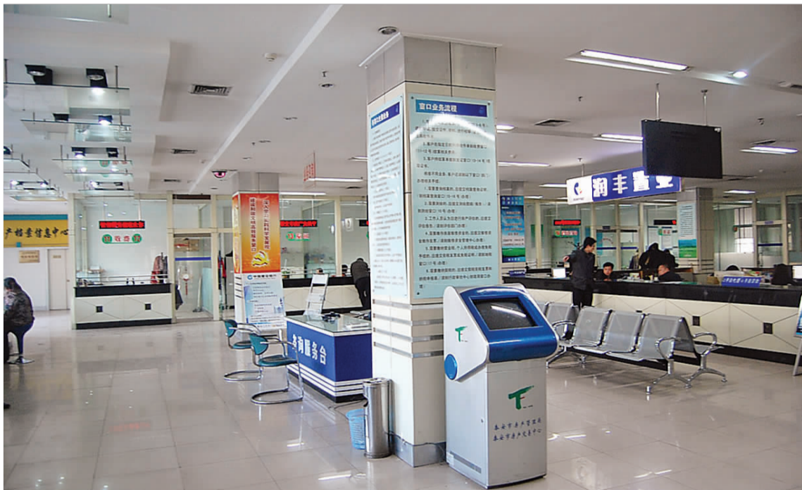
4日15时,泰安市房产交易中心空荡荡的。

据了解,为不影响市民出行,公交公司启动了应急预案,针对严寒天气,公司对所属的四个车队,每个车队重新配备了一台新的启动电源,以保证公交车按时启动、按时发车。各车队公交车驾驶员每天比以前提前一个小时到达车队,对车辆进行预热。