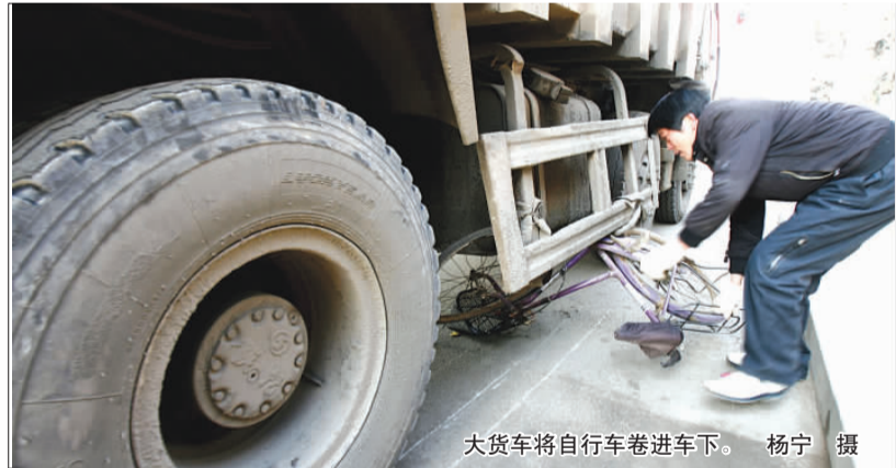
大货车将自行车卷进车下。

在青岛市中心医院急诊室,记者见到了陪同伤者来医院的肇事司机叶某。叶某说,他当时开车从周口路右转到洛阳路上,等信号灯时前面有两辆轿车,其中一辆直行,另一辆在他前面右转,他就开车跟着走,走着走着前面有人朝他招手,他停车一问才知道把人挂倒了,车轮下还轧了一辆自行